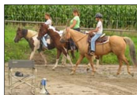
Brav trainiert, Mädels!