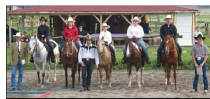
... und alle haben bestanden. Bravo!