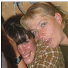
Lustig war's - wie immer!